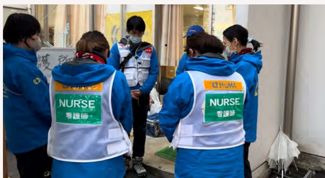
能登半島地震で珠洲市で活動する 医療ボランティア

9月下旬、復興途上にあった珠洲市で豪雨による洪水が発生しました。これを受け、ロシナンテスは、医療支援活動を行うHuMA（特定非営利活動法人災害人道医療支援会）と共同で、市内の高齢者介護施設で支援活動を行いました。ロシナンテスは現地で活動するボランティアを募集し、10月に1名の看護師を派遣しています。