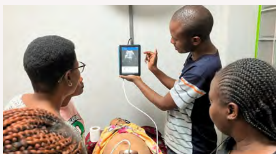
診療所スタッフへのエコー研修

また小型エコーを1台導入し、産前健診で、正確な診断と逆子や危険な兆候を把握することができるようになりました。新生児死亡率や妊産婦死亡率の低減につながる指標として、妊産婦の健診率やエコー受診率も重要視していきます。