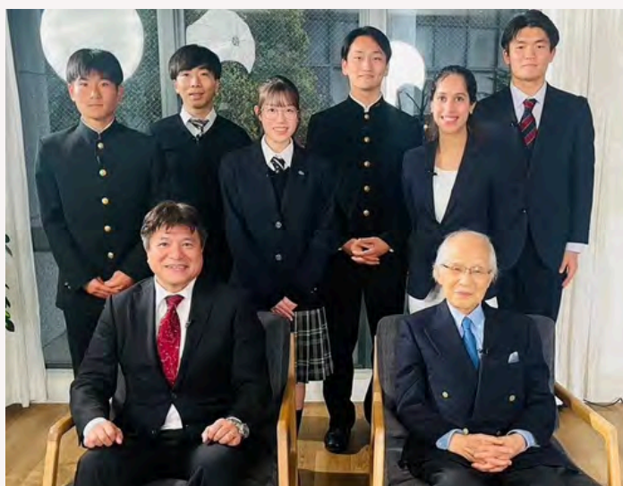
和やかに撮影は終了。 学生さんたちは熱心に 小和田さんのお話に耳を傾けていました

小和田恆さんは40年近くにわたって外交官として活躍され、TICAD(アフリカ開発会議)の立ち上げに尽力、その後国際司法裁判所所長などを歴任されました。「経済の発展=国の発展ではない」「パートナーシップ」など、現在の国際協力における重要な概念は、小和田さんが日本に持ち込んだと言っても過言ではありません。