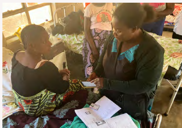
保健ボランティアへの使用方法の研修

ロシナンテスは現地でのデータ収集・分析などを担当し、これまでに中央州チサンバ郡の4つの医療施設で母子情報を収集してきました。また医療施設スタッフや保健ボランティアへの使用方法の指導も行いました。