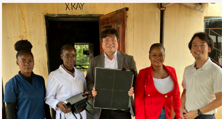
X線検査を行っているリテタ郡病院の技師さんたち

そこで、ロシナンテスは外務省からの助成を受け、今年7月にX線装置を4台に増やしました。これにより、さらに多くの患者さんがX線検査を受けられる体制が整いました。